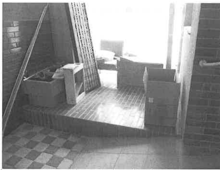
Pohled na stávající zatarasený východ do dvorní části areálu nemocnice.

Z atiky ploché střechy propojujícího krčku bude odstraněno oplechování a do stropní desky budou provedené 4 otvory DN 380 mm pro osazení světlovodů SOLATUBE 330 DS Pro VZT budou provedeny 3 otvory DN 150 / viz. výkres střechy /.