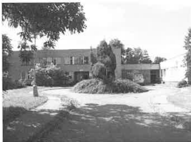
Pohled z komunikace Žižkova na pavilony E a F nemocnice Český Brod

Pavilon E je třípodlažní objekt, obdélníkového tvaru, přízemním krčkem propojený s přízemním obdélníkovým objektem pavilonu F. Oba objekty mají ploché střechy a jsou nepodsklepené. Nosnou konstrukci obou pavilonů tvoří skeletový systém sloupů 400/400 mm, ztužidel a průvlaků 650/cca 400 mm. Stropní konstrukce jsou železobetonové, panelové. Obvodový plášť je tvořen betonovými parapetními panely a pásy oken, které jsou v současné době vyměněné za bílé plastové stejných tvarů z profilu Trocal 76-AD. Do pavilonu E jsou vyměněné i vstupní dveře z profilu Gealan S 8000. Tyto výplně dodala firma .