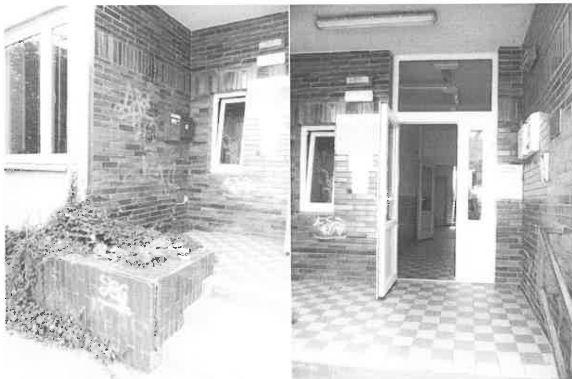
Pohled na stávající stav vstupního prostoru do pavilonu E