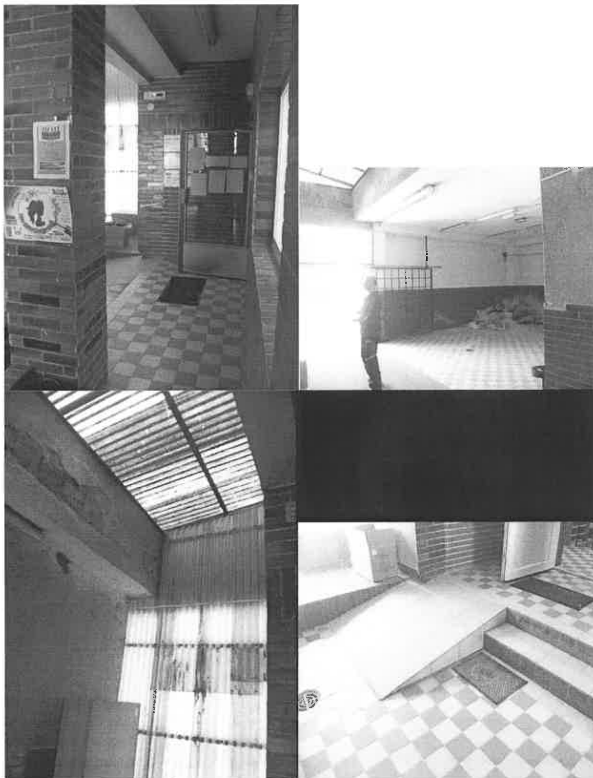
Pohled na stávající zastřešení krčku a vstup do přízemního pavilonu F

Celkově lze konstatovat, že veřejné vstupy jak do pavilonu E, tak do pavilonu F vůbec neodpovídají současným standardům veřejných prostor. Nejsou zde vyřešeny bezbariérové