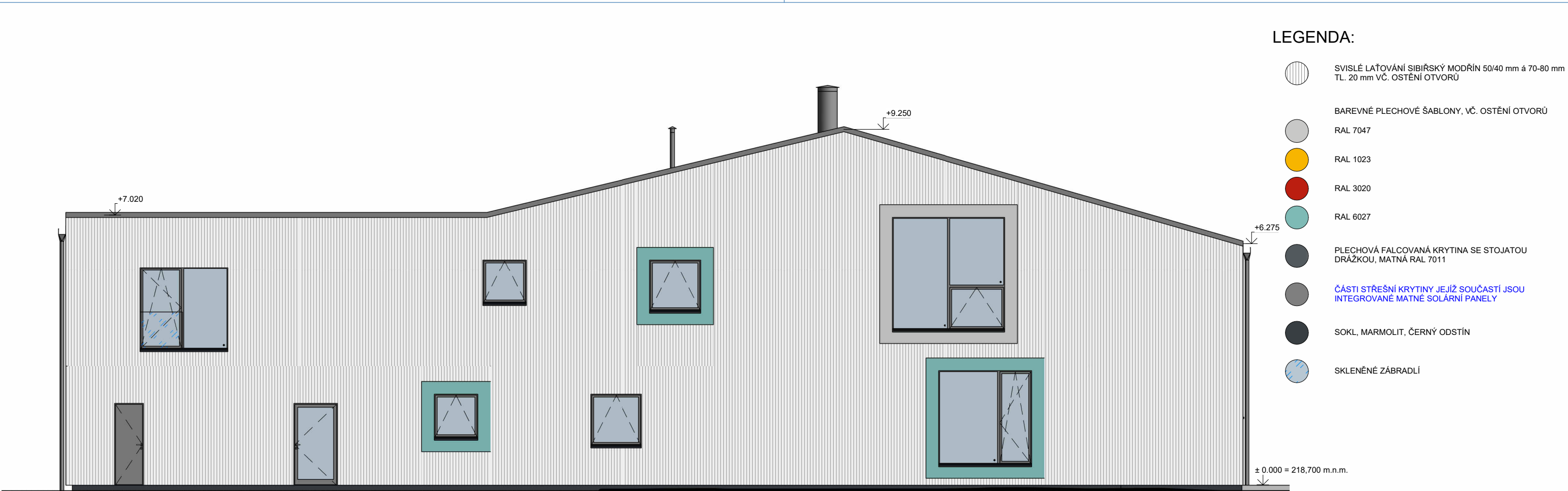
P11 1 : 100